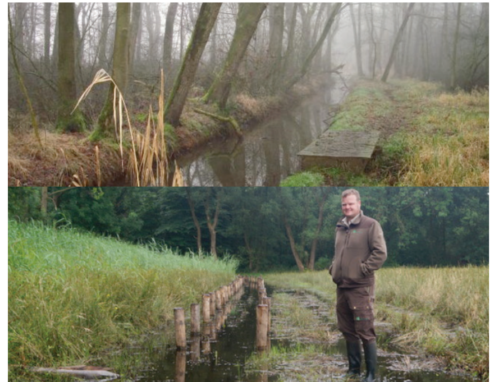
Foto: de boswachter bij de aanleg van het knuppelpad.